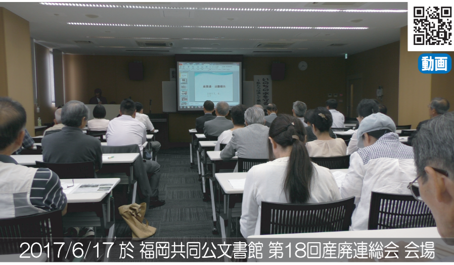
2017/6/17 於 福岡共同公文書館 第18回産廃連総会 会場

市民の命の水である県営山神ダムの約1.2km上流域にある日本最大級(約130万立方メートル)の産廃安定型処理場内で、平成11年10月6日、硫化水素が原因で従業員3人が死亡するという重大な事故が発生したことにより、将来にわたるダムの水質に対する不安が増幅するとして、その問題解決に向け引き続き行動していくことを出席者全員一致にて決議されました。